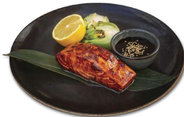
Salmón escocés teriyaki