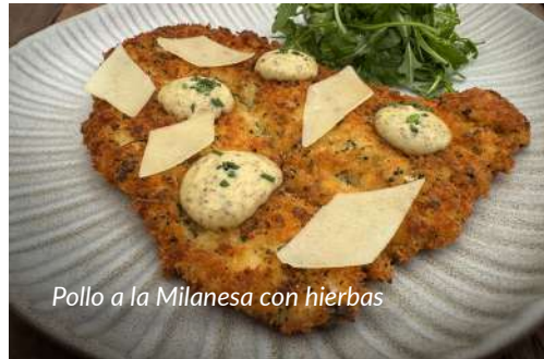
Pollo a la Milanese con hierbas

Puré de patata con mantequilla, bimi a la plancha, jugo de vino tinto