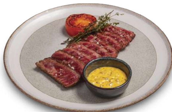
Bistec de Ternera Wagyu