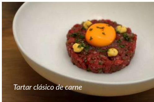
Tartar clásico de carne