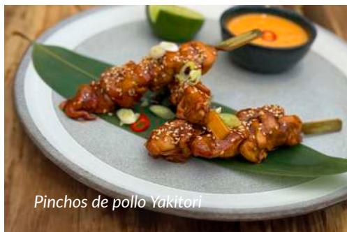
Pinchos de pollo Yakitori