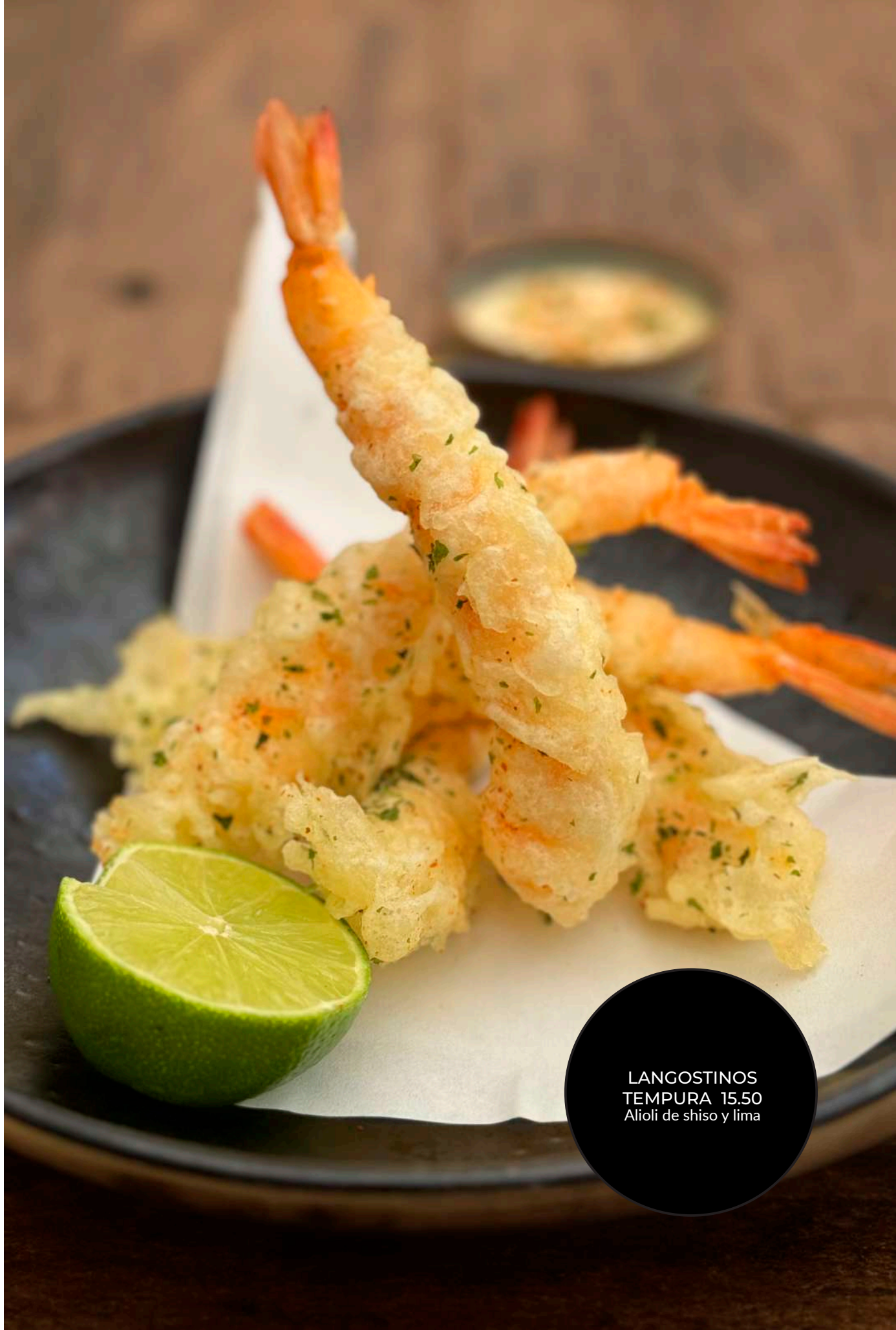
LANGOSTINOS TEMPURA 15.50 Alioli de shiso y lima