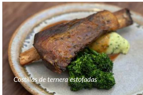
Costillas de ternera estofadas